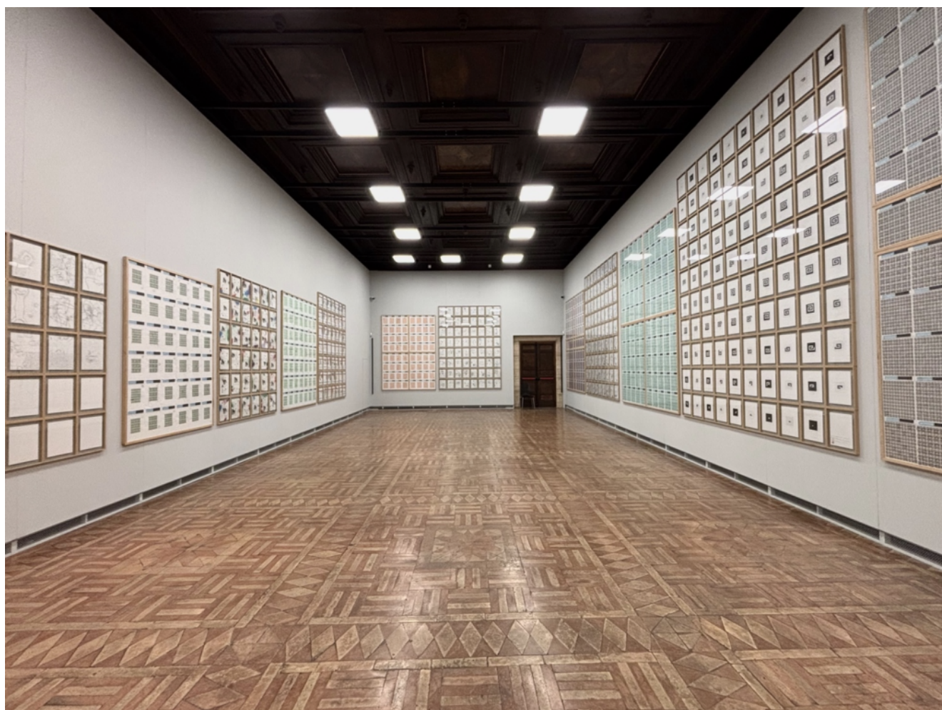
Accademia Nazionale di San Luca, Alighiero e Boetti. Raddoppiare dimezzando , a

E poi la moltiplicazione secondo progressioni matematicamente controllate: Storia naturale della moltiplicazione (1974-1975) rappresenta l'espansione di forme nere su carta quadrettata secondo un continuo divenire. L'uso della carta a quadretti impone una struttura, una griglia limitante, che viene progressivamente sopraffatta dal segno dell'artista, riflettendo sulla dualità tra rigore e libertà, tra predeterminazione e sviluppo organico. L'opera è realizzata su 11 fogli di carta. Due volte uno. Un sistema binario come quello del computer, l'ordinateur. Scrive Claudio Strinati sul catalogo della mostra: «Alighiero Boetti è un ordinatore spericolato e insieme razionalissimo di istanze comunicative che sembrerebbero sovrastarci e del resto nell'amato francese il computer, che Alighiero sembrerebbe desiderare e temere al contempo, si chiama ordinateur».