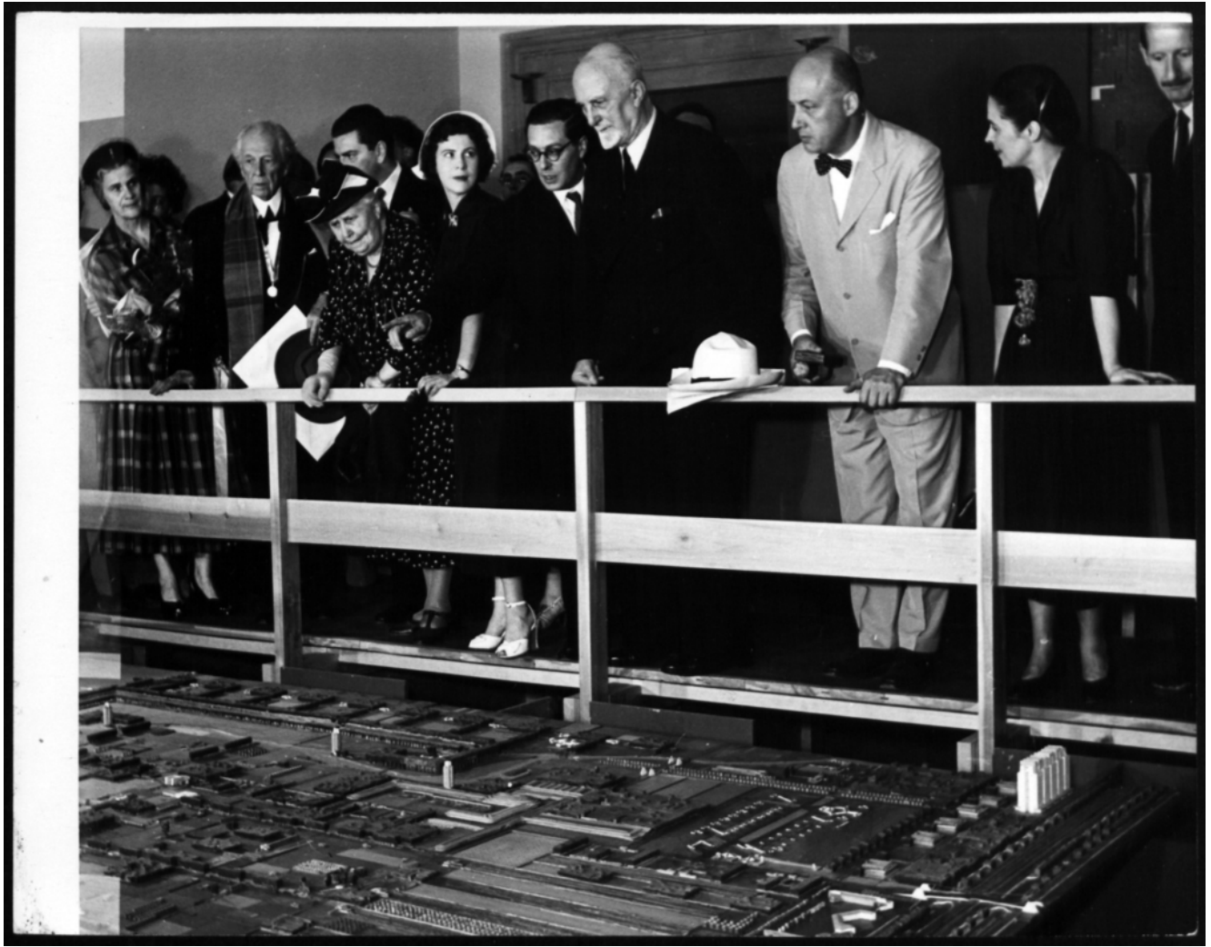
Vista del grande plastico di Broadacre city. Basterebbe questa foto per comprendere la rivelanza della mostra.