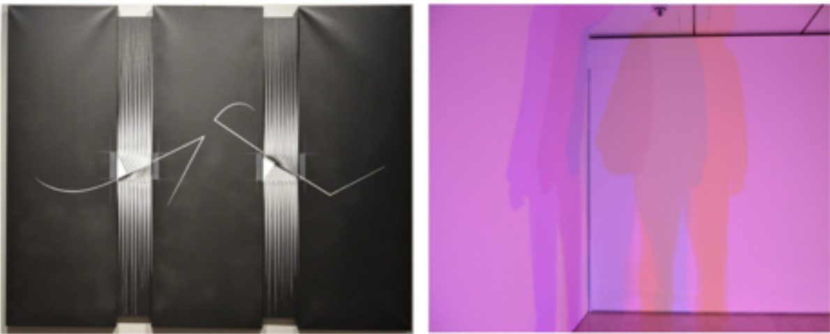
A. Biasi, Acrobati in attesa impaziente , n.d. A destra: A. Biasi, Tu sei

Le ultime due sezioni sono "Assemblaggi" e "Ambienti". Nella prima, l'artista attraverso un ritorno alla pittura con l'uso di colori acrilici, crea opere di rara efficacia, In "Ambienti", sembra voler dar modo al fruitore di riscoprire sé stesso, di risvegliare la spensieratezza e il divertimento che soltanto i bambini vivono integralmente. In queste due sezioni Biasi chiede al fruitore una partecipazione ancora più attiva, data l' interattività che le opere in questione comunicano.