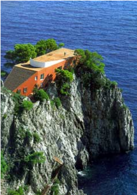
villa Malaparte a Capri